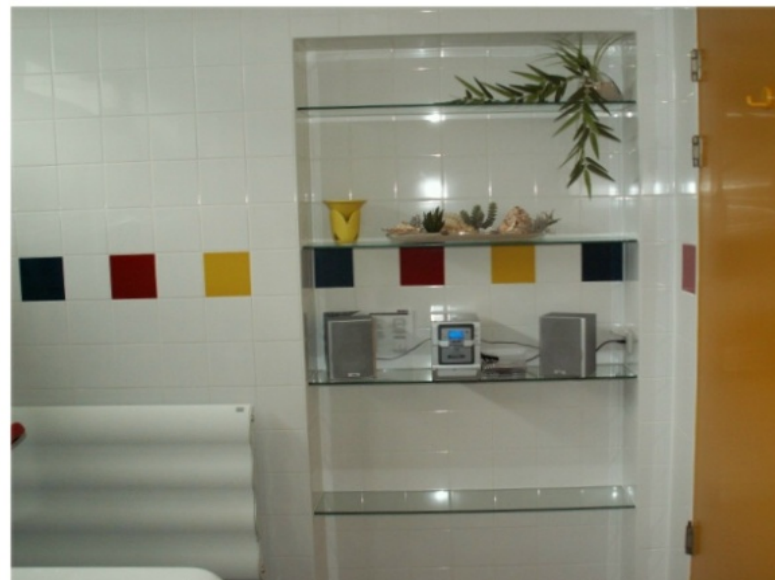
Wellness Pur "Nachher"