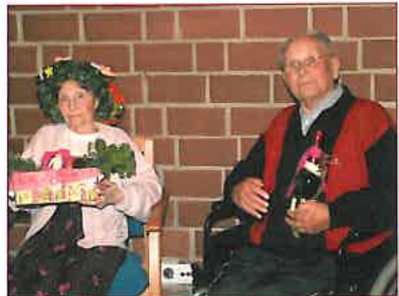
Unser Maikönigspaar 2009

„Es macht Spaß mit Ihnen zu tanzen.“ Auch die anderen Gäste nahmen diese Gelegenheit gerne wahr und ließen sich dieses Vergnügen nicht vorenthalten. Schnell fanden sich genügend Damen ein und die Tanzfläche füllte sich.