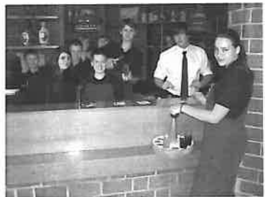
Die Jüngsten waren die Fleißigsten

Wer Fragen an die Freiwilligen Feuerwehr hat oder Interesse an deren Arbeit, der kann sich auf deren Homepage www.ff-Urbach.de über alles informieren oder schaut bei den regelmäßigen Treffen am 2.ten Montag (19:00 Uhr) bzw. 4.ten Samstag des Monats einmal vorbei.