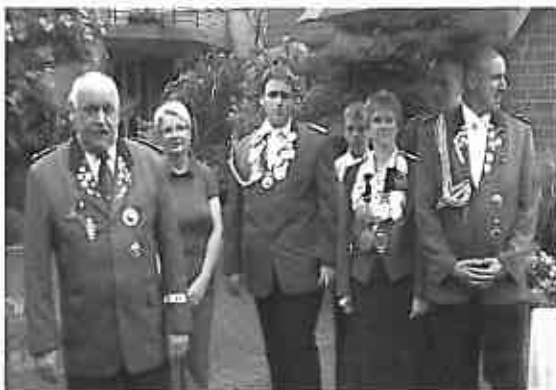
Königin Ulrike und Prinzgemahl Harald

Einen schönen Sommer-Abend konnten alle Bewohner und Gäste im Altenzentrum beim traditionellen Platzkonzert der St. Hubertus Schützenbruderschaft Porz-Urbach von 1926 e.V. erleben. Zum 83. mal feierten die Schützen ihr Schützenfest und auf dem Vereinsgelände in der Bartholomäusstrasse in Urbach wurde 5 Tage