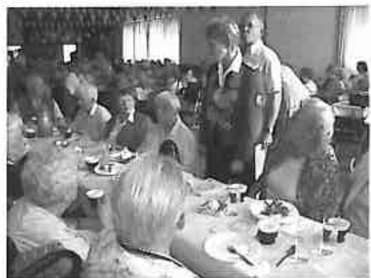
Voller Saal im Schützenheim

Ihr Fest begonnen hatten die Schützen bereits am Freitag mit einem sehr schönen Seniorennachmittag im herrlich hergerichteten Vereinsheim, den wir mit vielen unserer Bewohner des Altenzentrums ebenfalls genießen durften. Der Damenchor Urbach, das Tanzcorps der Urbacher Räuber, und viel Politprominenz wussten ihr Publikum zu begeistern.