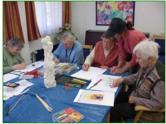
Malen + Gestalten