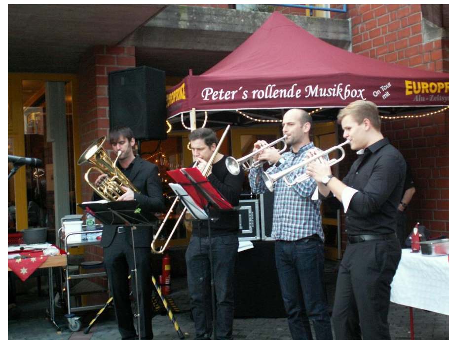
Die Auftritte des Kirchenchor Urbach-Elsdorf und ein Bläserquartett sorgten für musikalische Höhepunkte.